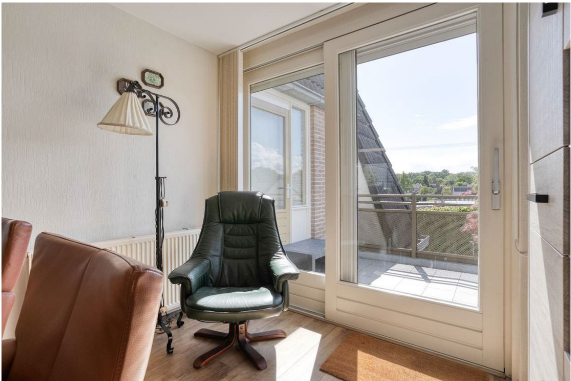
Woertheweg 3e te Hellendoorn