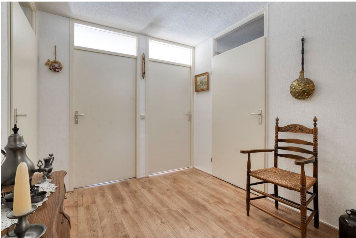
Woertheweg 3e te Hellendoorn