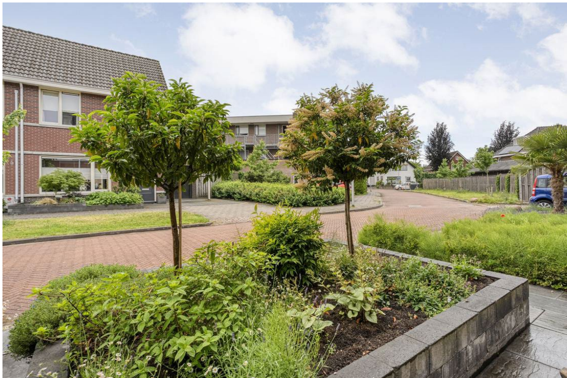
Berkelstraat 5 te Nijverdal