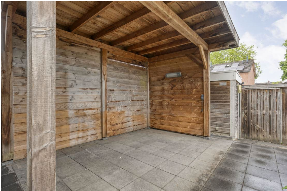
Berkelstraat 5 te Nijverdal