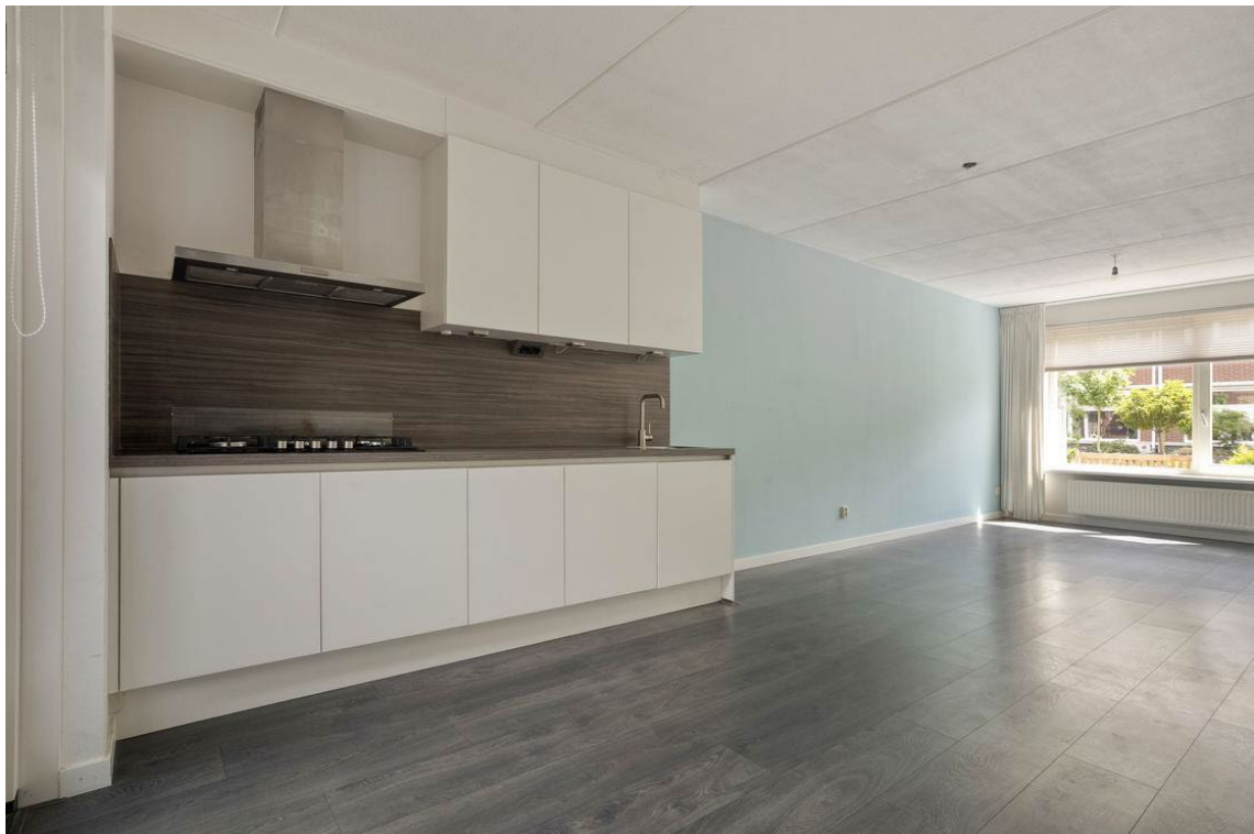
Berkelstraat 5 te Nijverdal