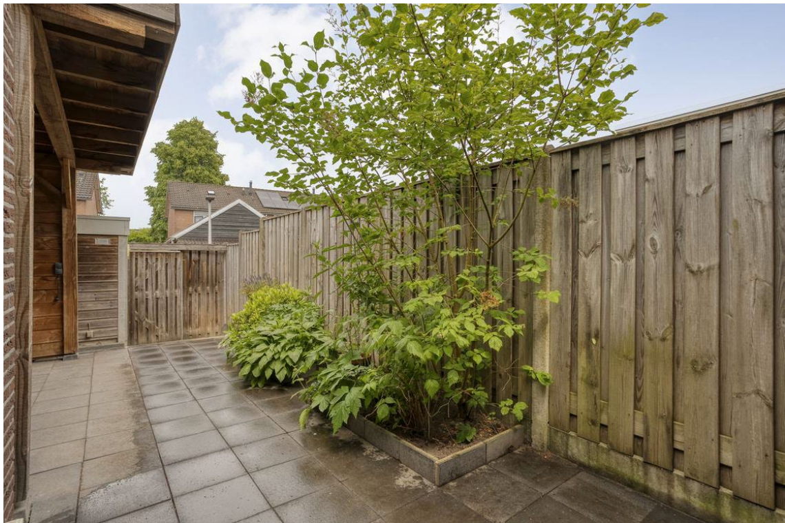
Berkelstraat 5 te Nijverdal