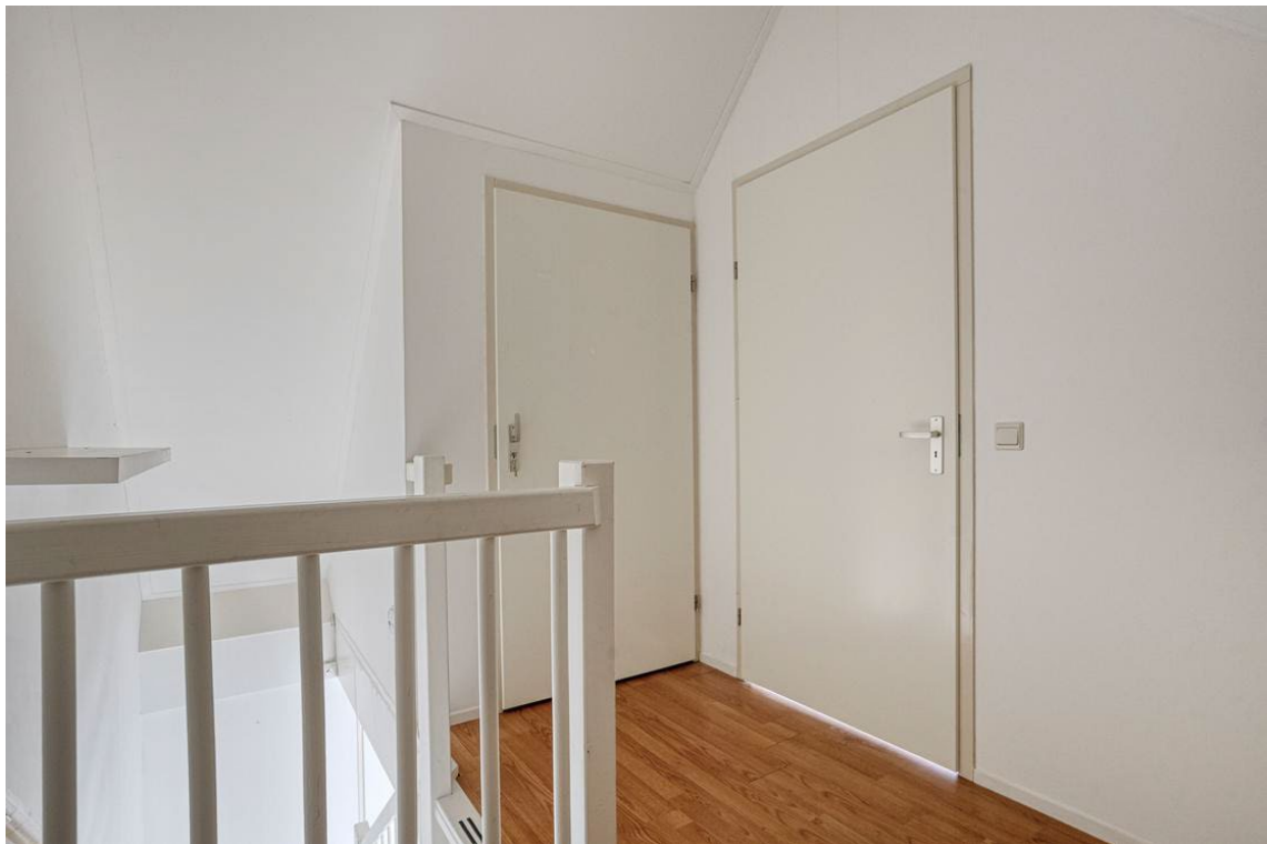
Berkelstraat 5 te Nijverdal