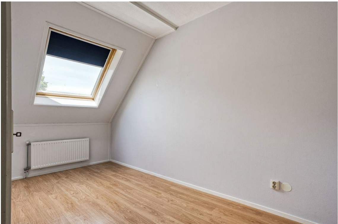
Berkelstraat 5 te Nijverdal