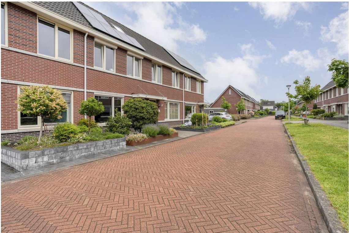
Berkelstraat 5 te Nijverdal