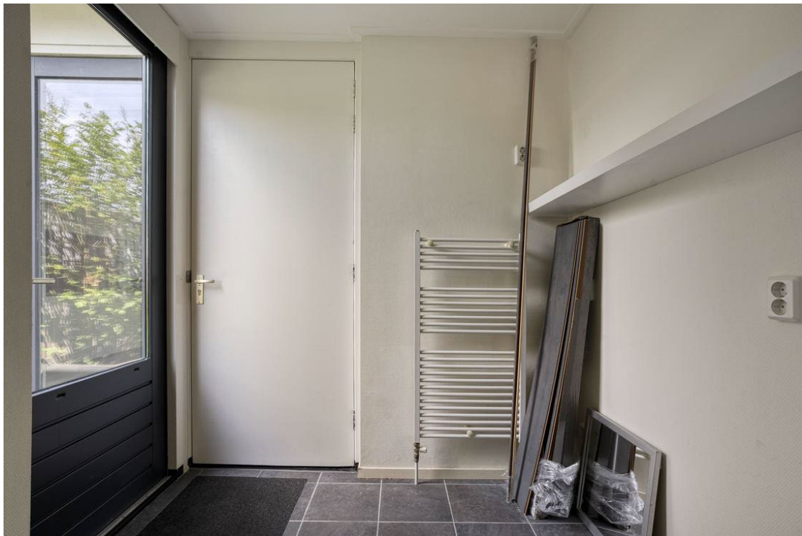
Berkelstraat 5 te Nijverdal