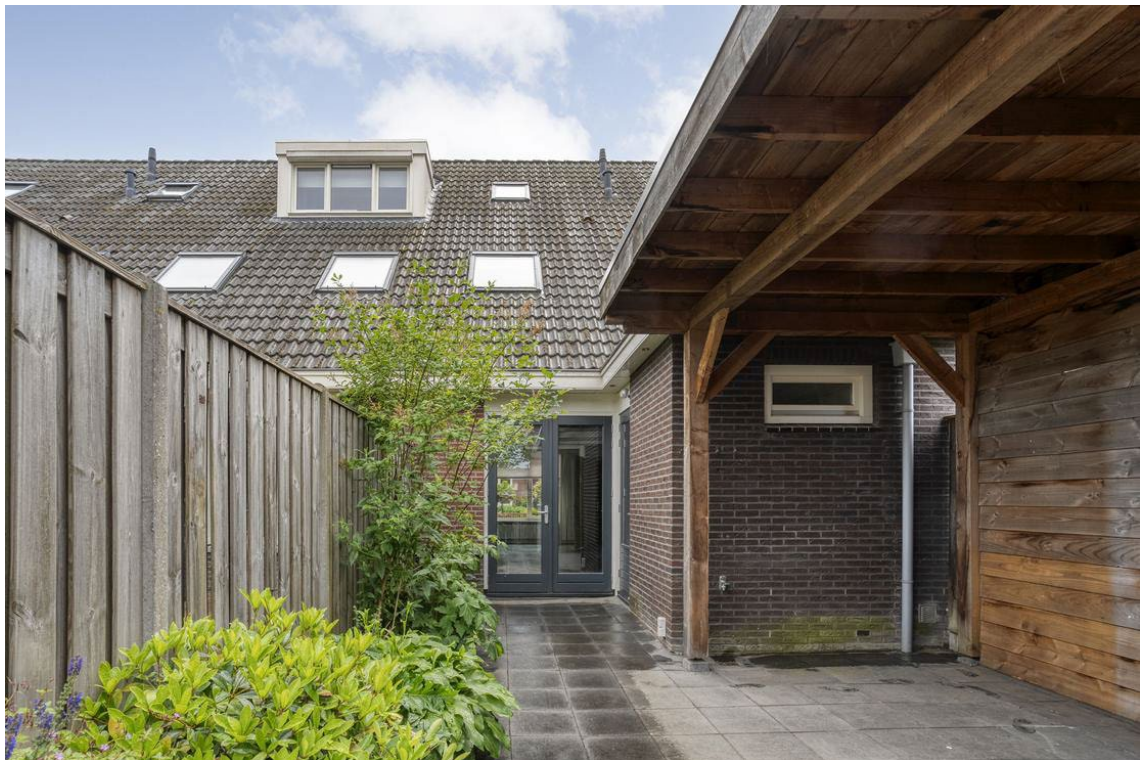
Berkelstraat 5 te Nijverdal