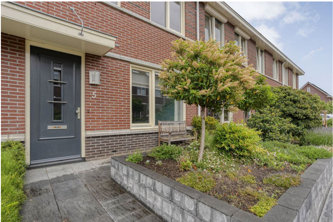
Berkelstraat 5 te Nijverdal