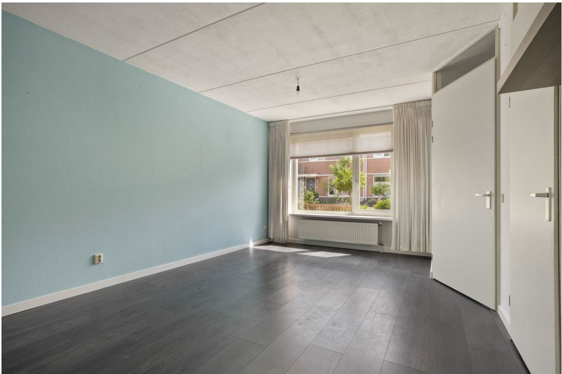
Berkelstraat 5 te Nijverdal