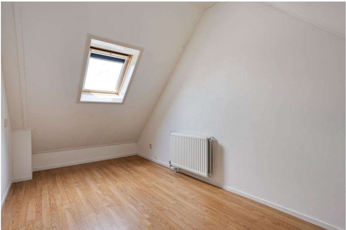
Berkelstraat 5 te Nijverdal