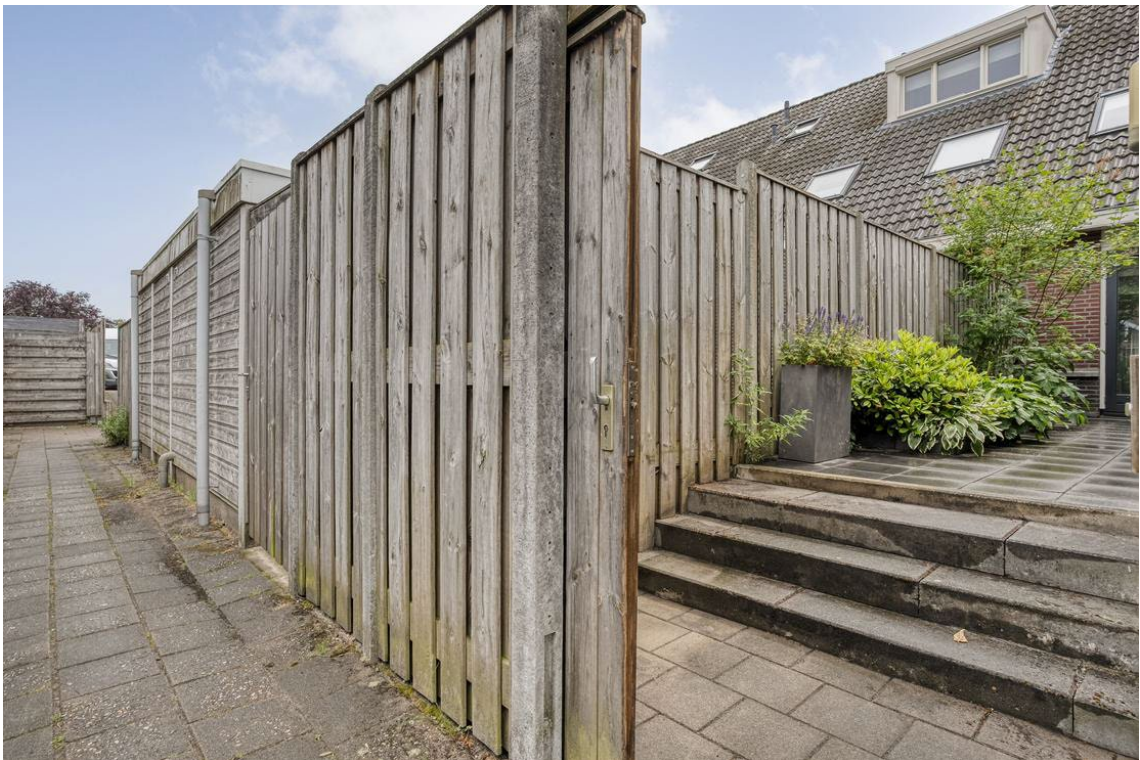
Berkelstraat 5 te Nijverdal