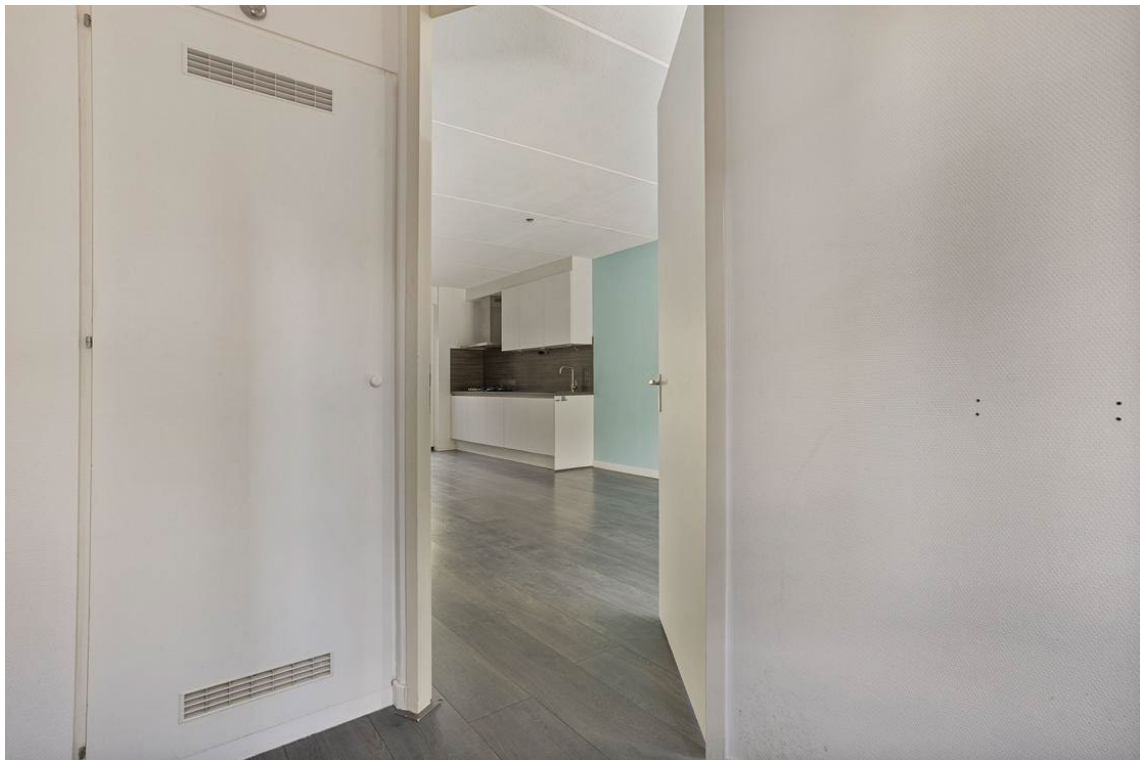
Berkelstraat 5 te Nijverdal