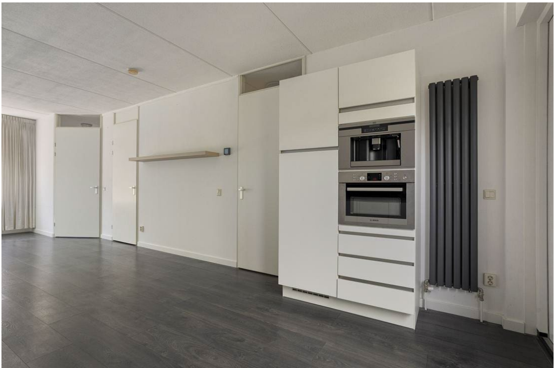
Berkelstraat 5 te Nijverdal