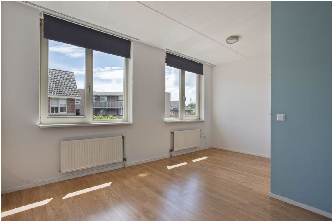
Berkelstraat 5 te Nijverdal