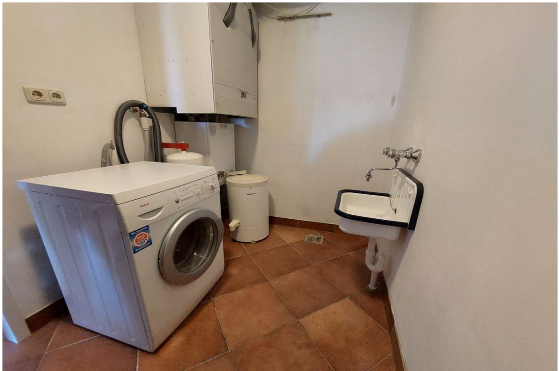
Molenweg 502 te Nijverdal