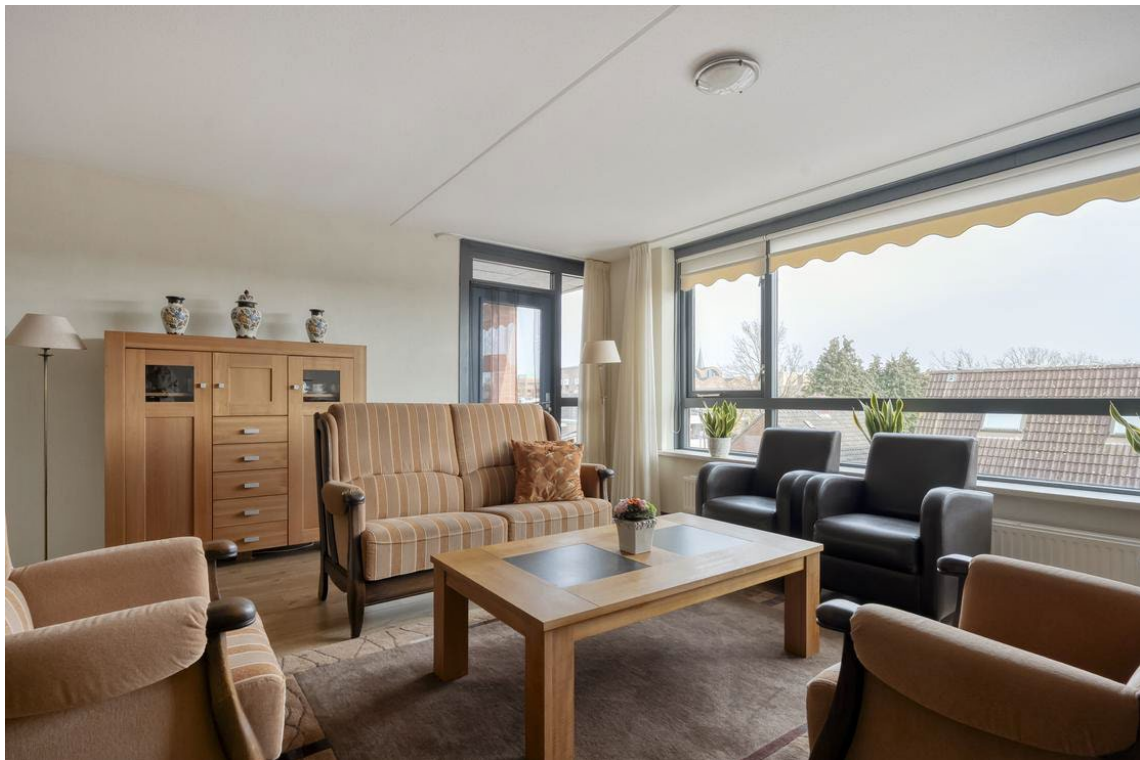
Molenweg 502 te Nijverdal