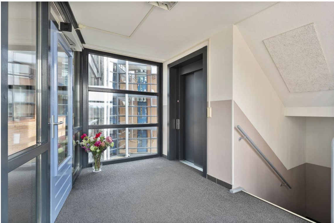
Molenweg 502 te Nijverdal