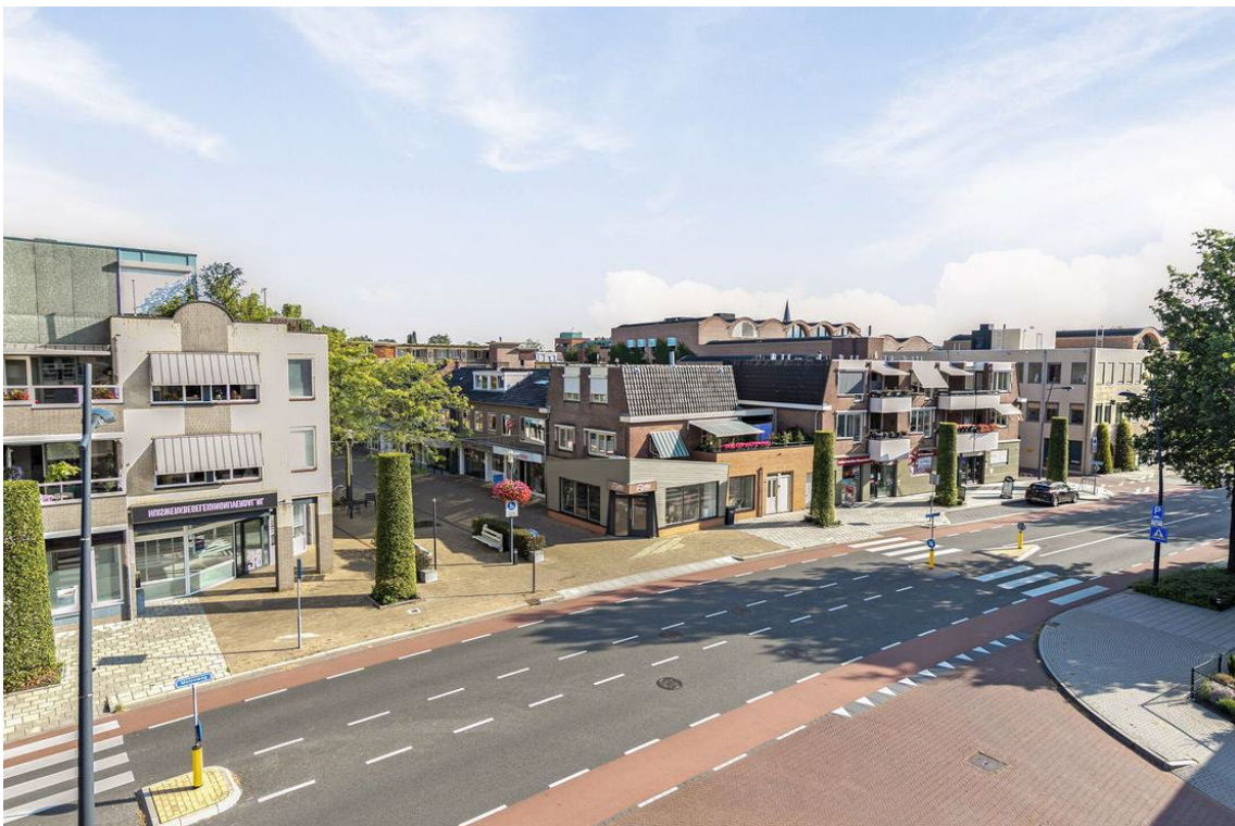
Molenweg 502 te Nijverdal