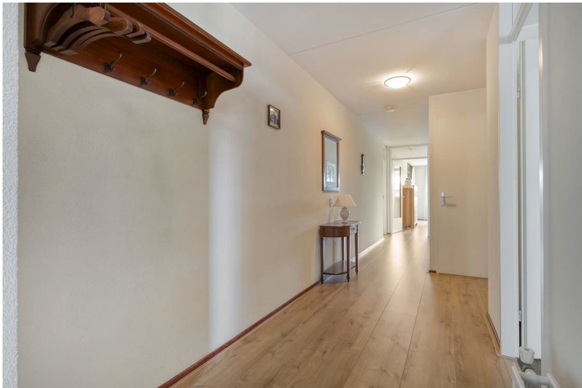
Molenweg 502 te Nijverdal