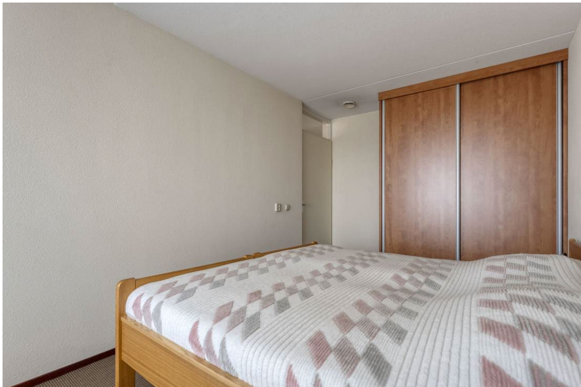
Molenweg 502 te Nijverdal