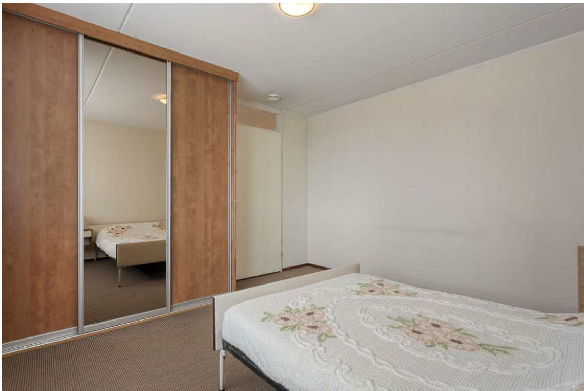
Molenweg 502 te Nijverdal