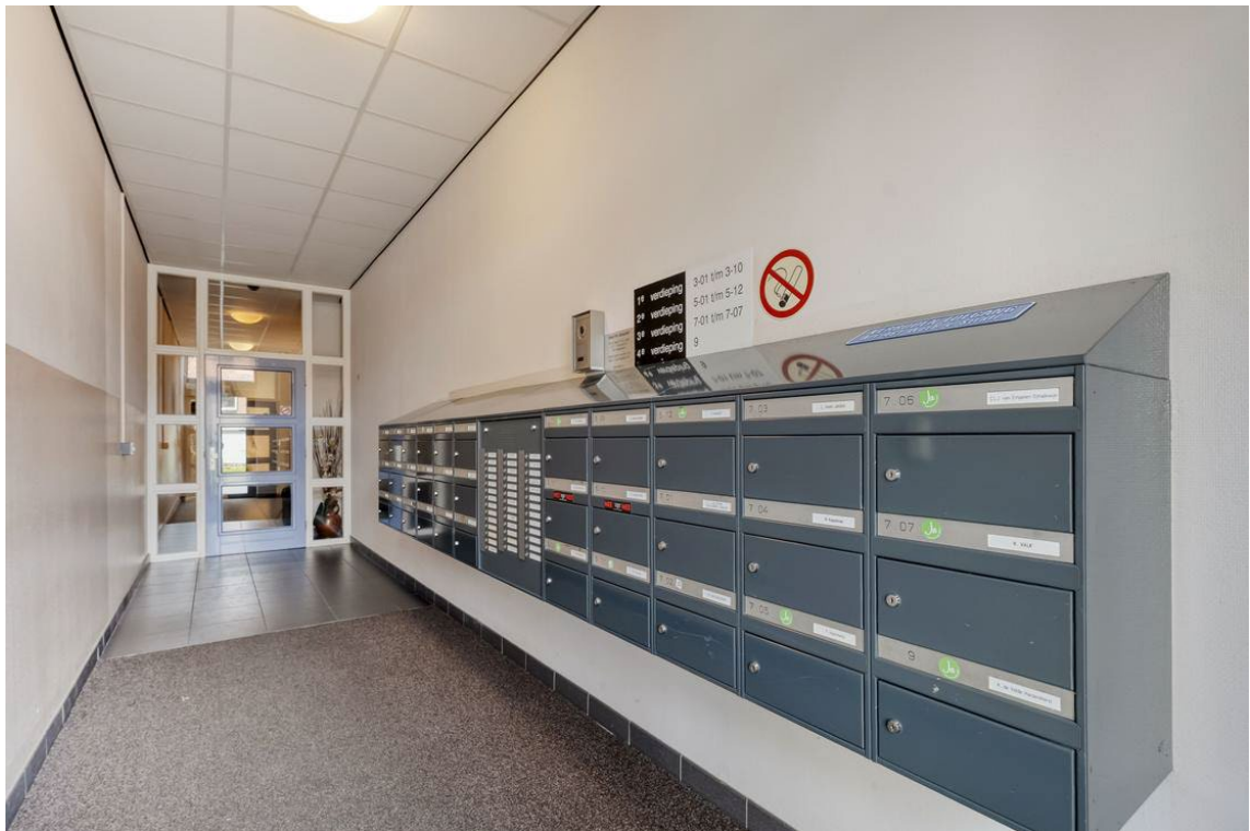
Molenweg 502 te Nijverdal