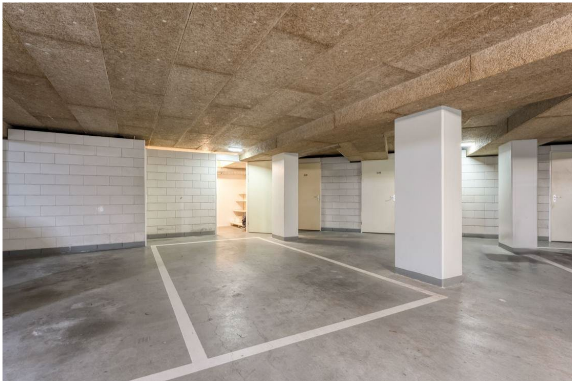
Molenweg 502 te Nijverdal