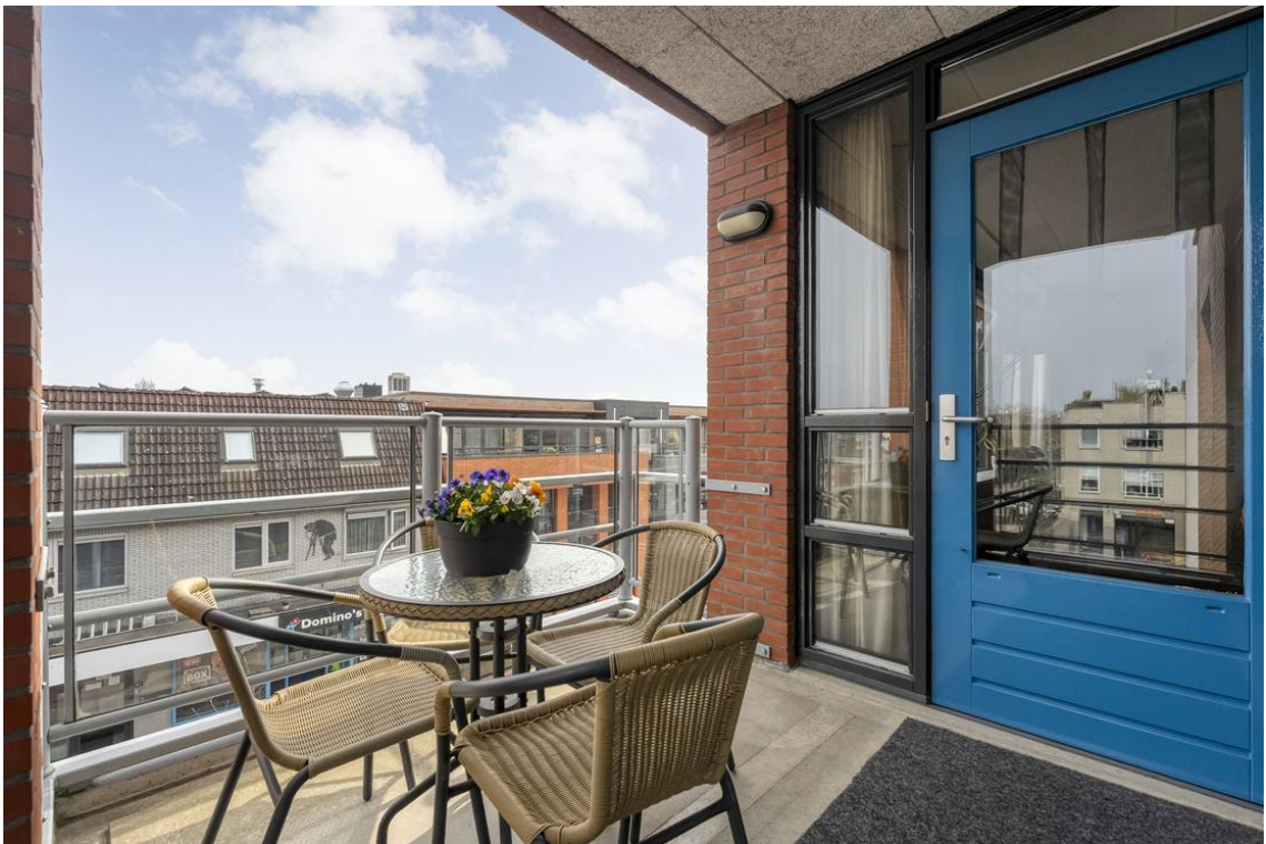
Molenweg 502 te Nijverdal