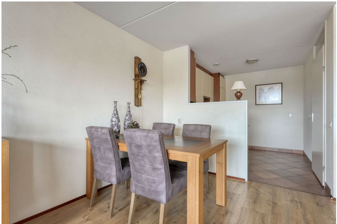
Molenweg 502 te Nijverdal