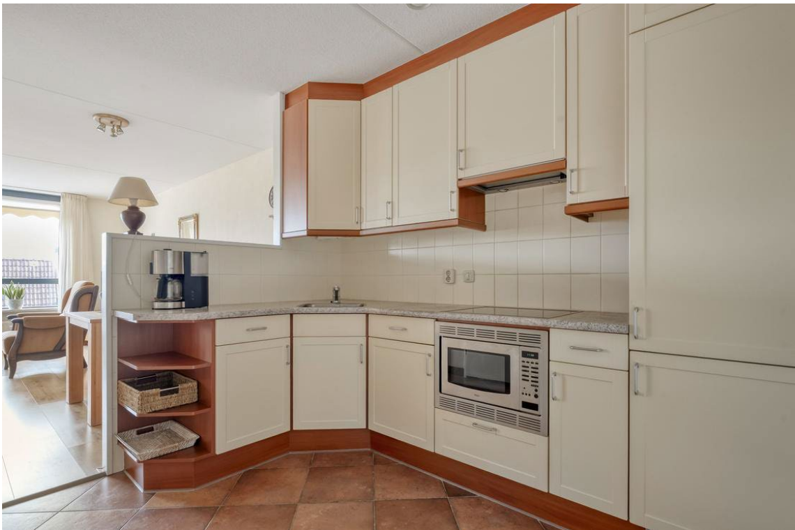
Molenweg 502 te Nijverdal