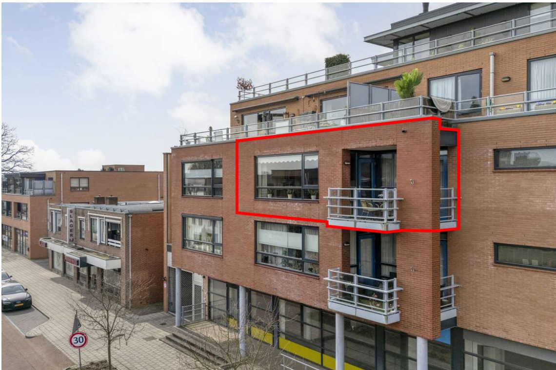
Molenweg 502 te Nijverdal