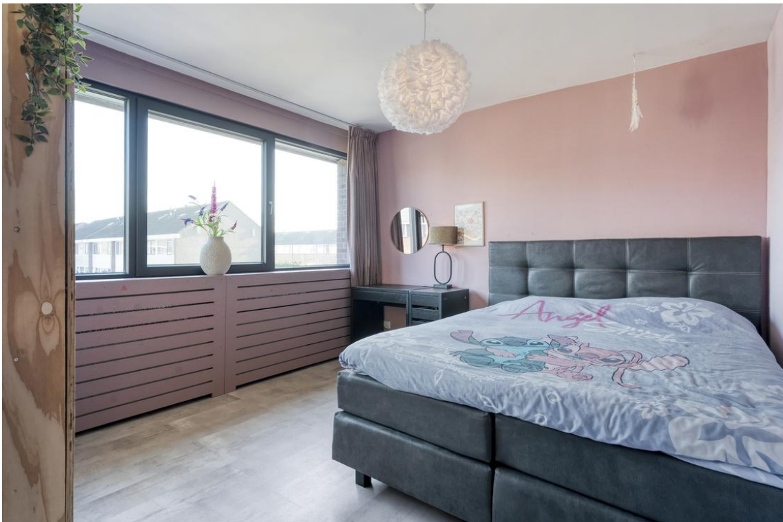
P C Boutensstraat 38 te Nijverdal