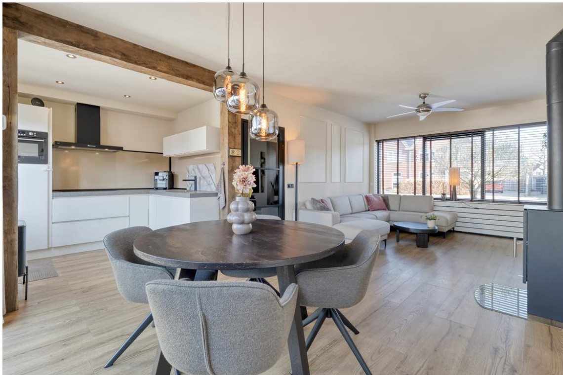
P C Boutensstraat 38 te Nijverdal