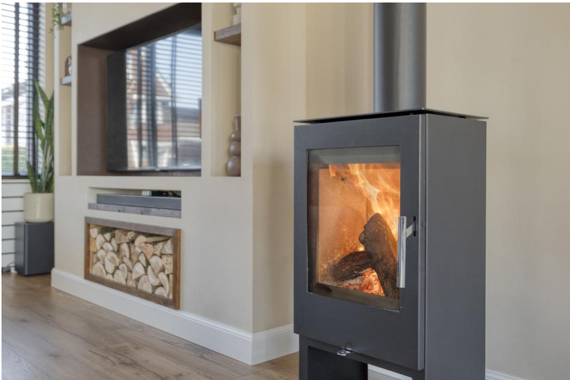
P C Boutensstraat 38 te Nijverdal