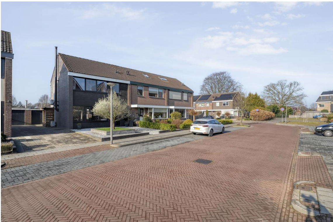
P C Boutensstraat 38 te Nijverdal