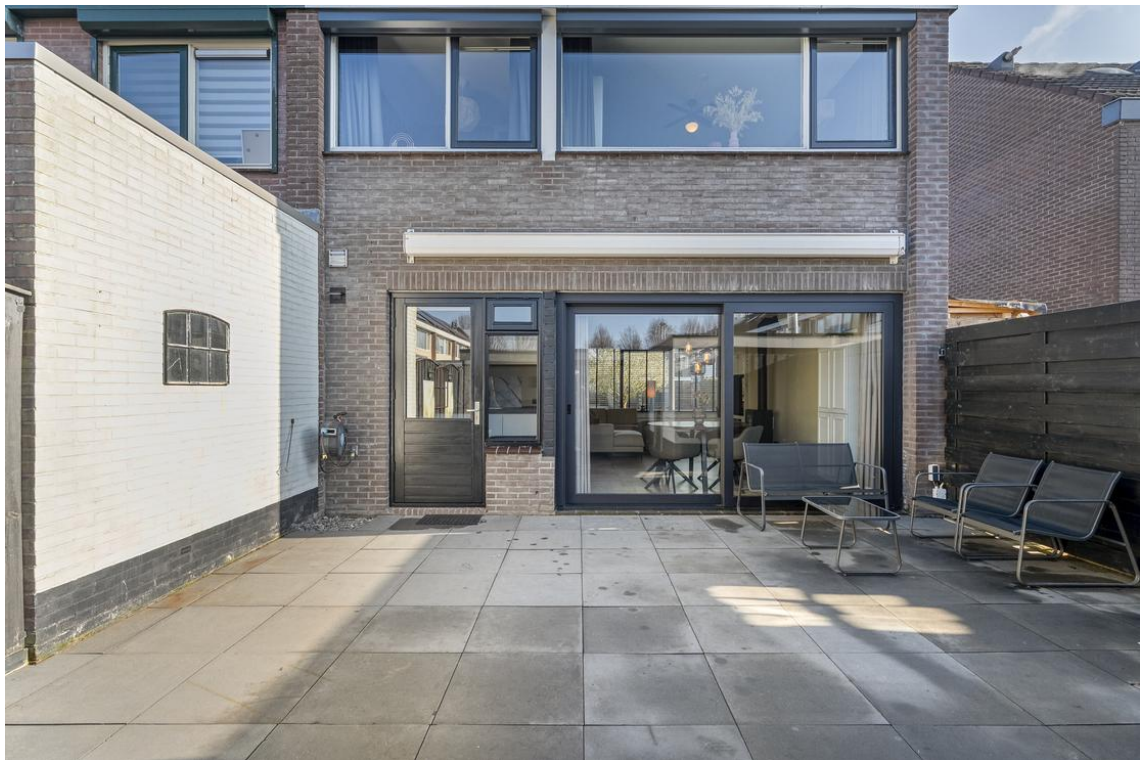
P C Boutensstraat 38 te Nijverdal