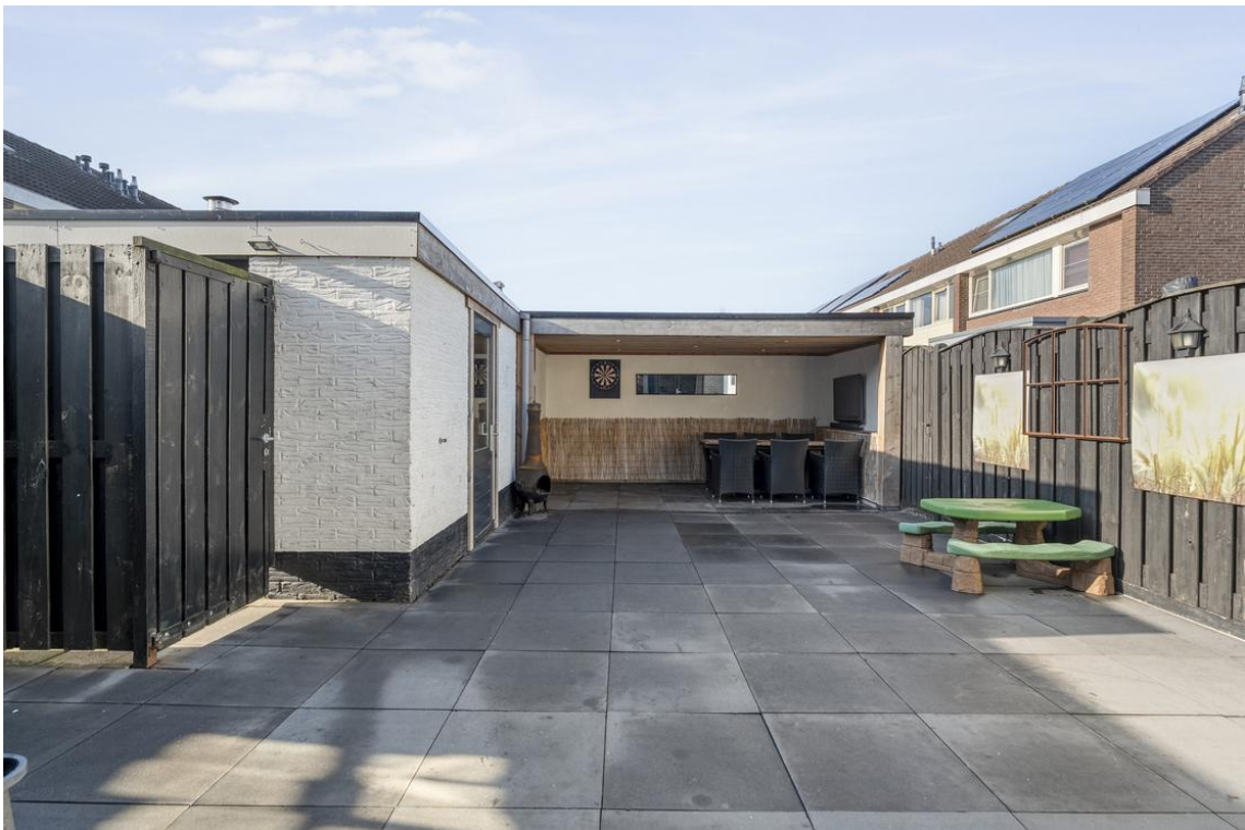
P C Boutensstraat 38 te Nijverdal