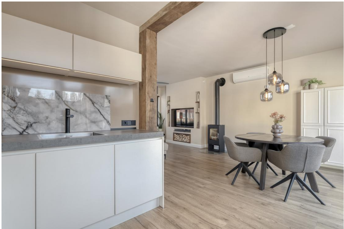
P C Boutensstraat 38 te Nijverdal