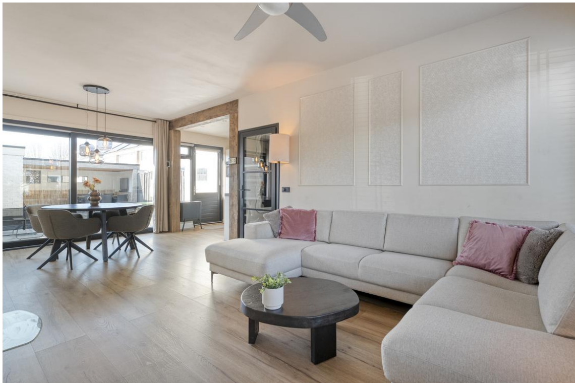
P C Boutensstraat 38 te Nijverdal