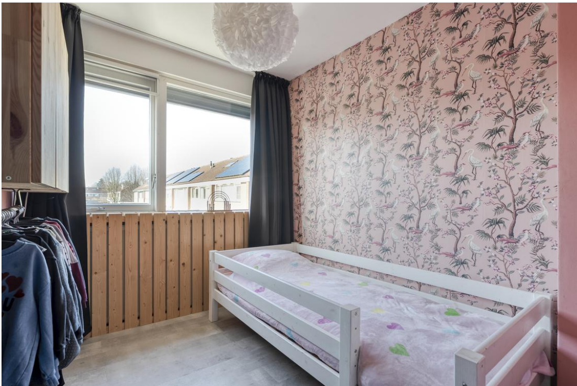
P C Boutensstraat 38 te Nijverdal