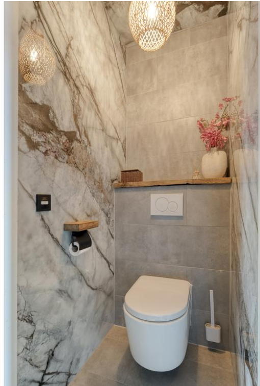
P C Boutensstraat 38 te Nijverdal