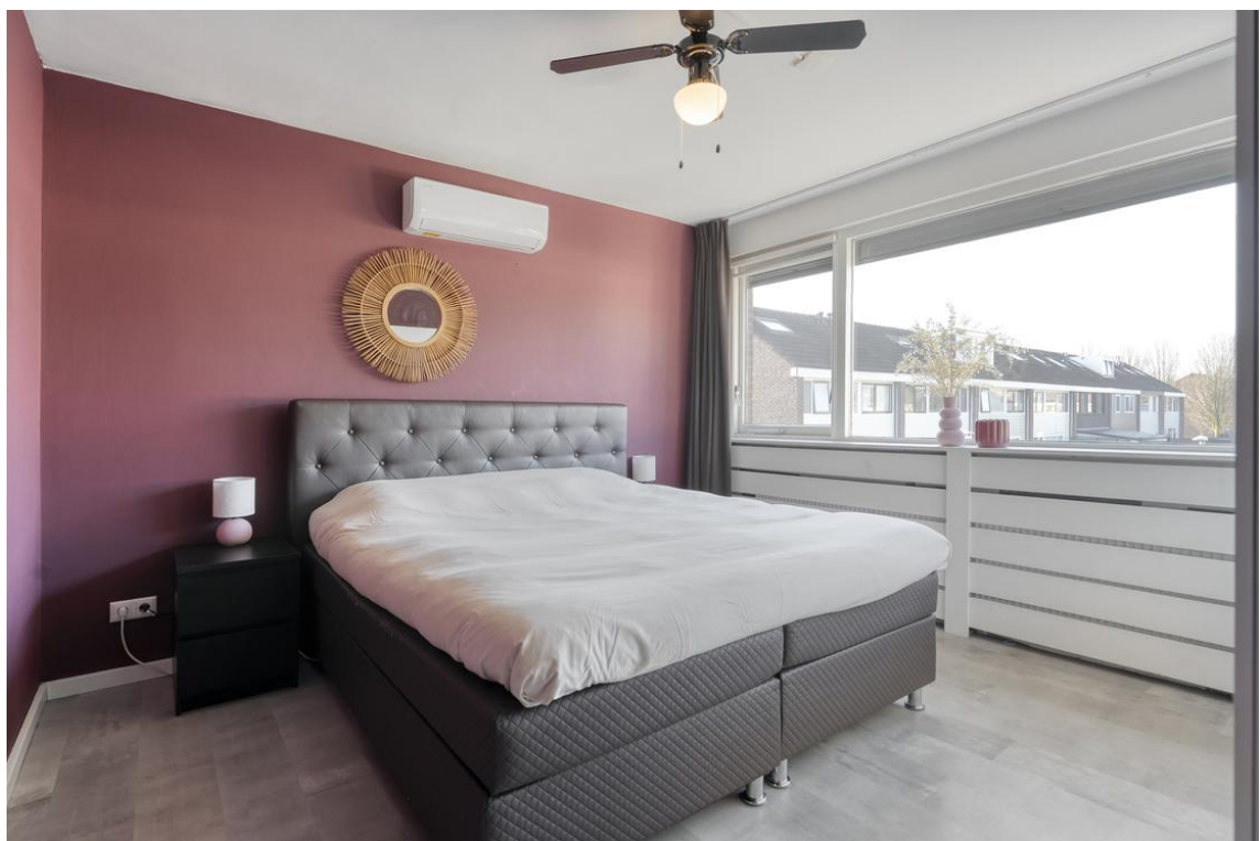
P C Boutensstraat 38 te Nijverdal