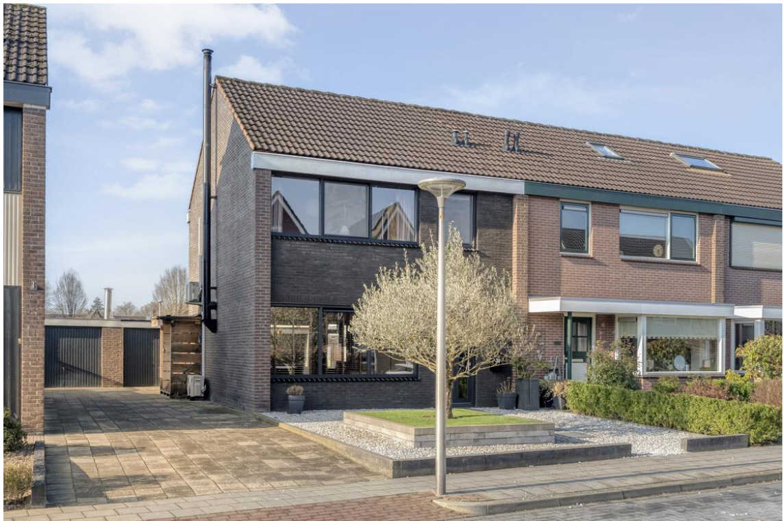
P C Boutensstraat 38 te Nijverdal