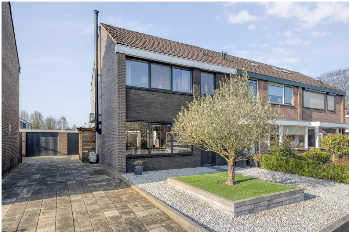
P C Boutensstraat 38 te Nijverdal