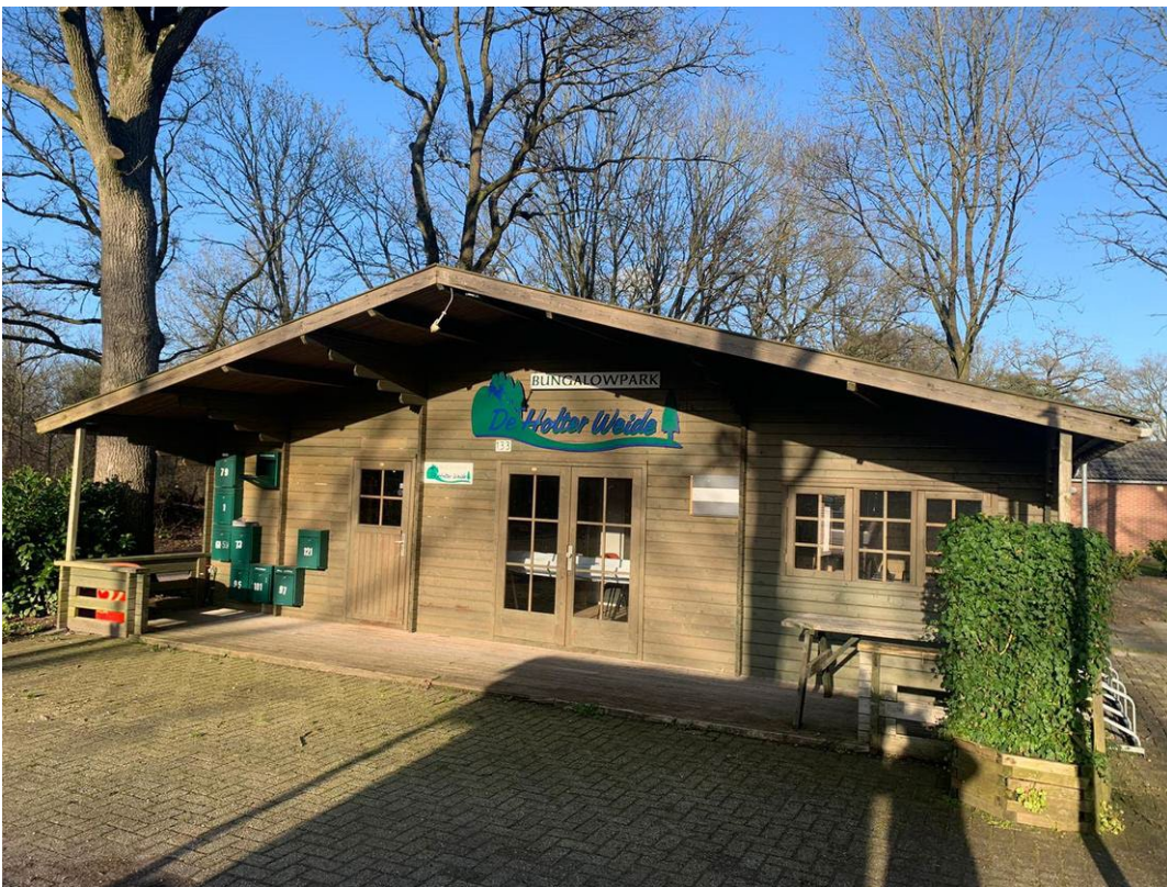
Wildweg 129 te Holten