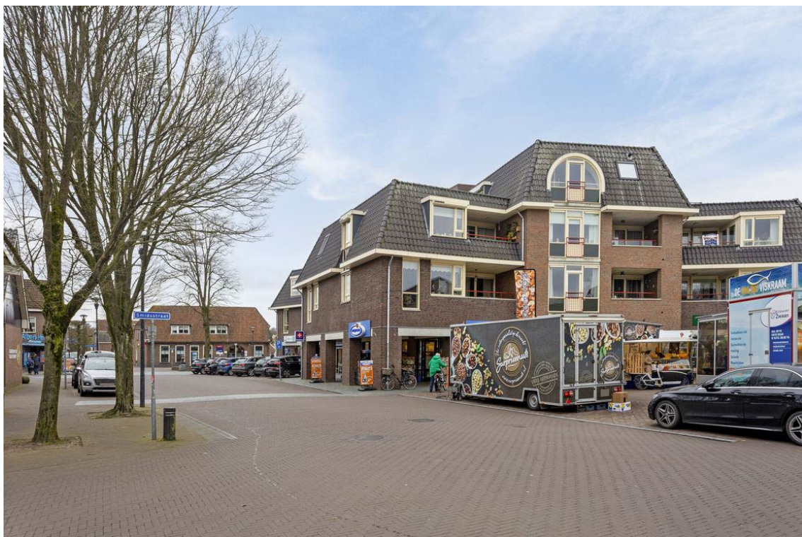
Schapenmarkt 8 te Hellendoorn