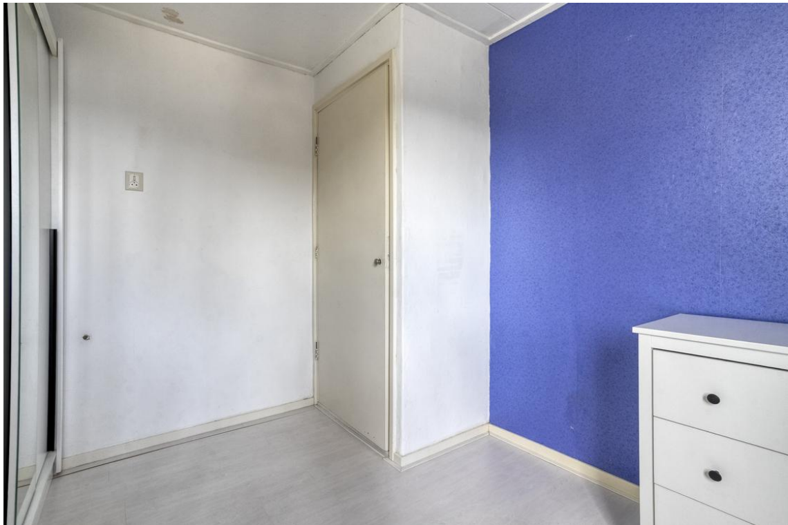
Holterweg 26a te Nijverdal