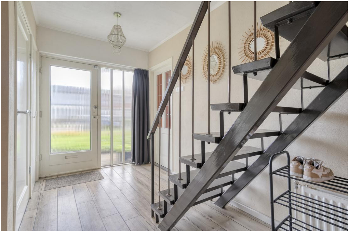
Holterweg 26a te Nijverdal