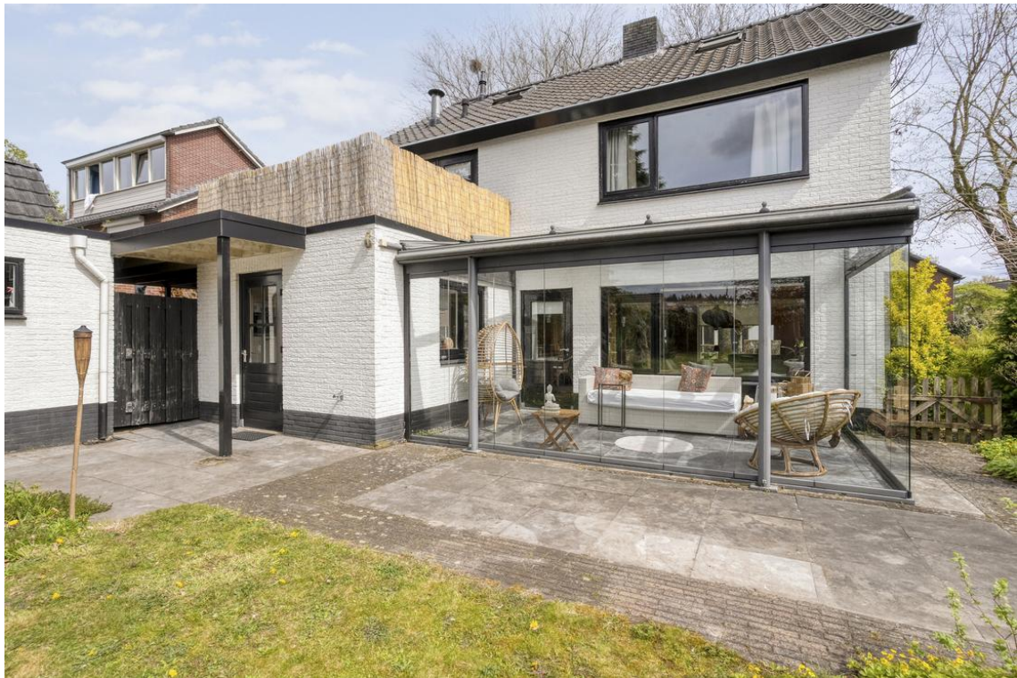
Holterweg 26a te Nijverdal