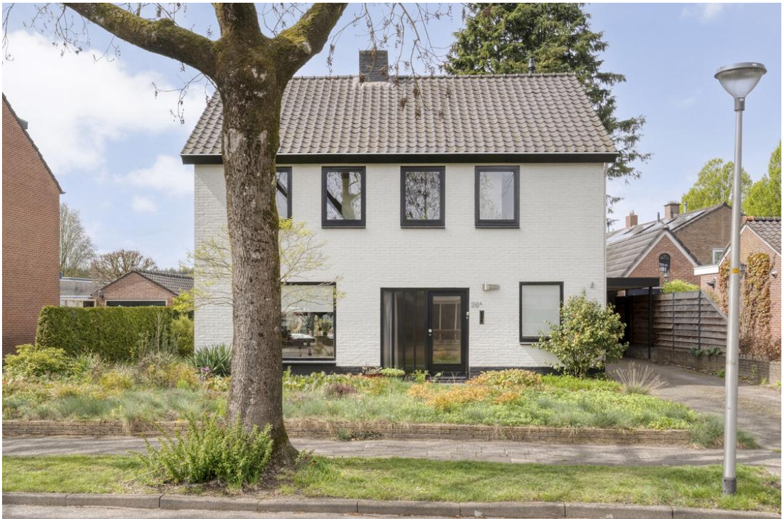
Holterweg 26a te Nijverdal