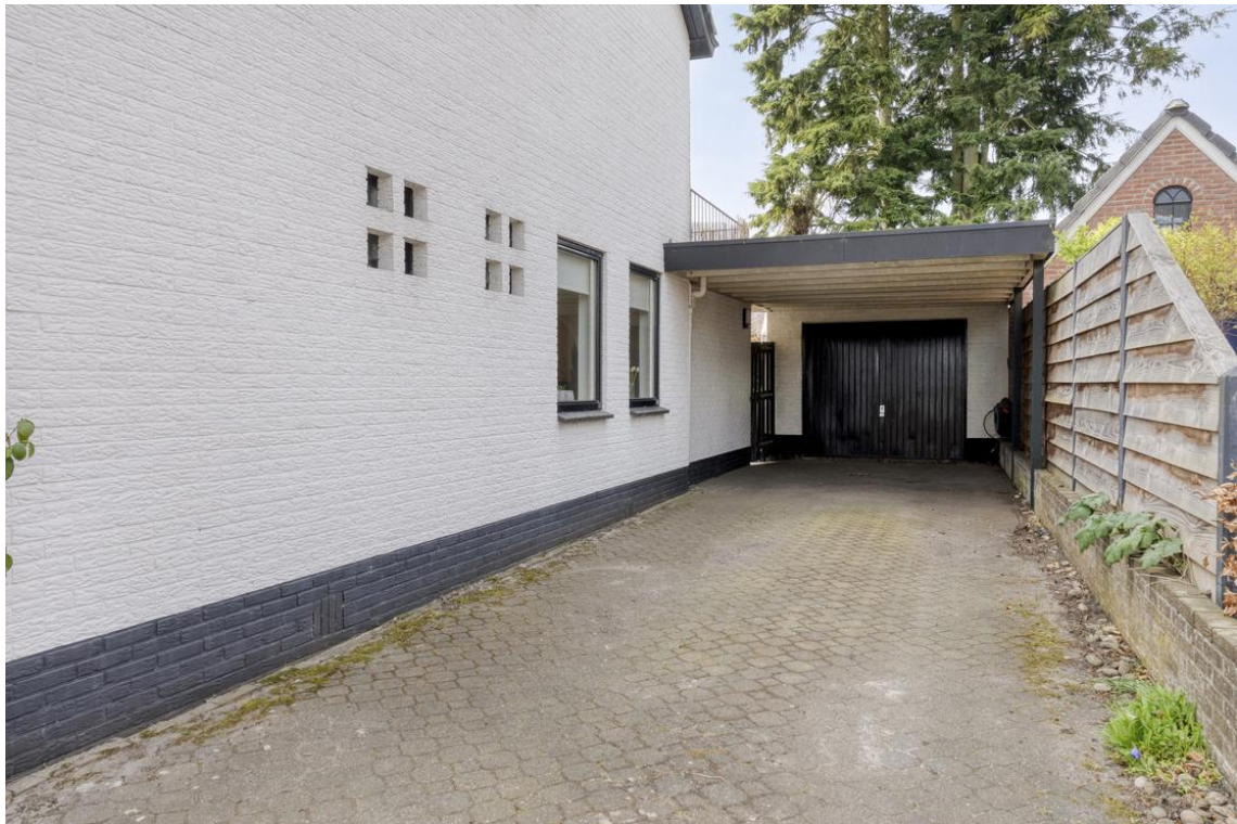
Holterweg 26a te Nijverdal