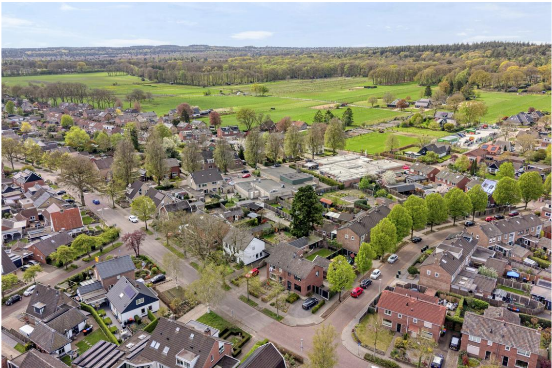
Holterweg 26a te Nijverdal