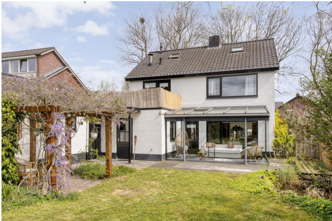
Holterweg 26a te Nijverdal