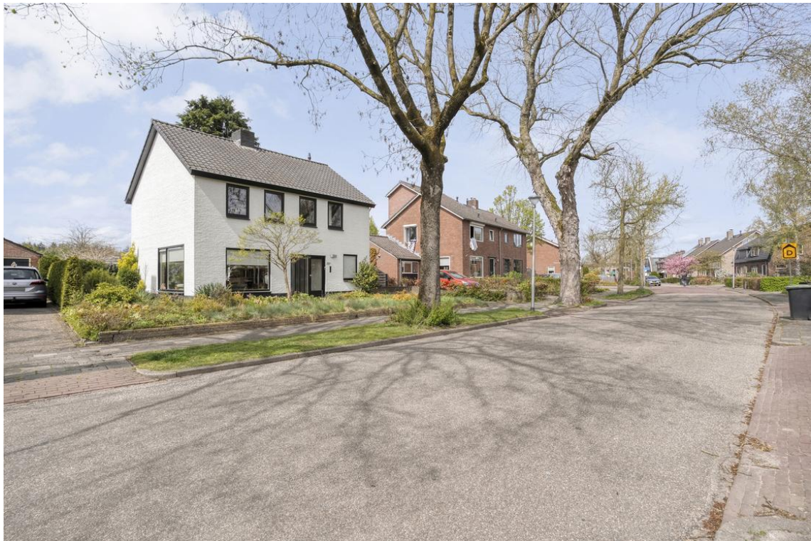
Holterweg 26a te Nijverdal