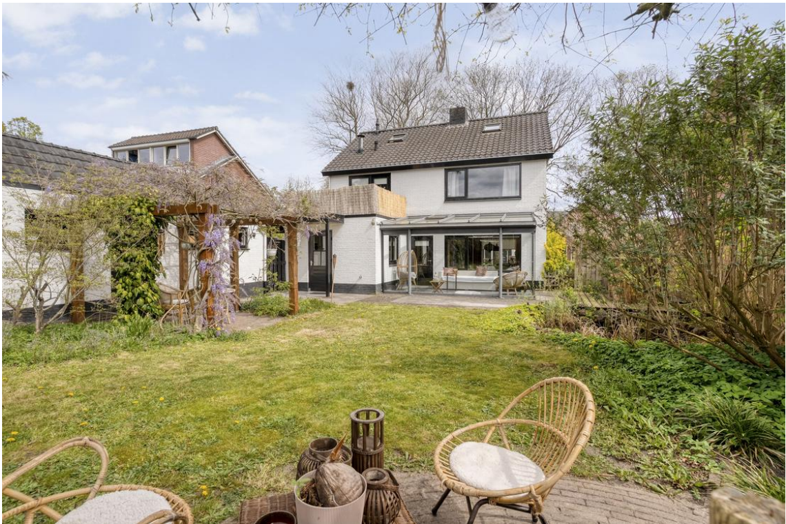
Holterweg 26a te Nijverdal